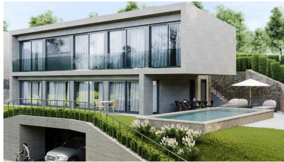
Haus B – VERKAUFT